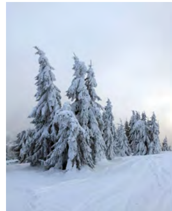
Feldberg, am 25.01.2019